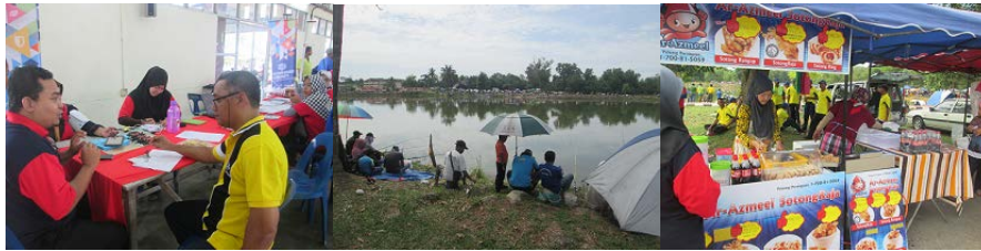
3/ Hari Sukan Negara Kampung Banggol Rashid, Selama, Kedah