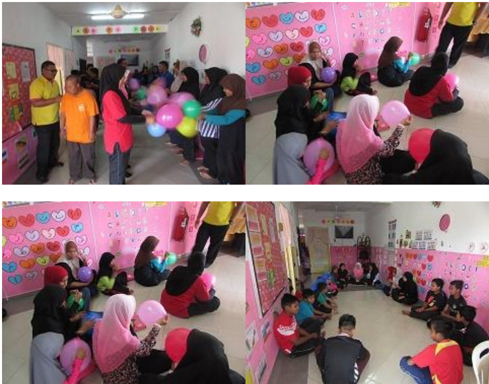
4/ Program Dashboard Komuniti PI1M Sg. Batu