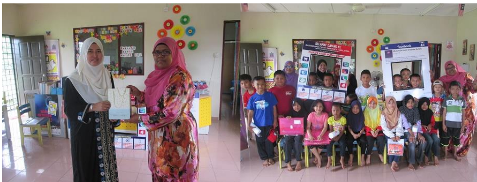
3/ Program Santai Ilmu bersama PI1M Kuala Selama dan Sg. Batu anjuran Pusat Aktiviti Kanak-kanak Daerah Bandar Baharu, Kedah